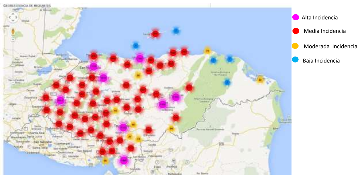
Mapa No 1: Incidencia de la población migrantes adultos retornados de Honduras año 2014.